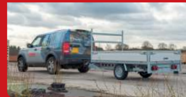
Plateauwagen is ook leverbaar in enkelas uitvoering. Anhänger auch als Einachser lieferbar.