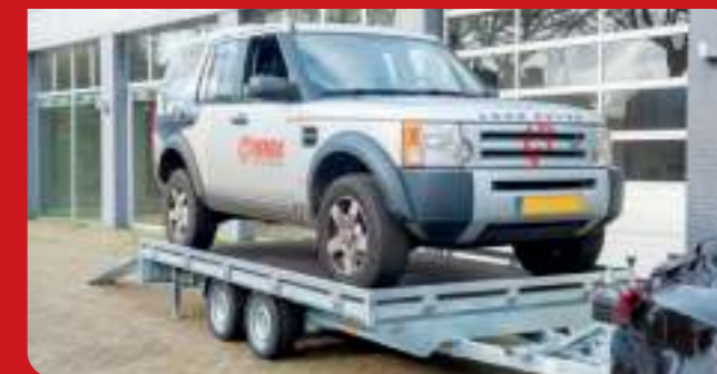
Plateauwagen is ook als autotransporter leverbaar (optiepakket). Anhänger auch als Autotransporter (Optionspaket) lieferbar.