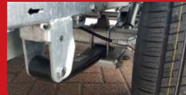
Optioneel is de plateauwagen ook leverbaar met parabool vering. Standaard voorzien van schokbrekers.

Optional ist der Hochlader auch mit Parabol Dämpfung lieferbar. Standard mit Radstoßdämpfer.